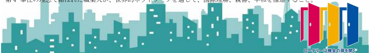
ロータリーは機会の扉を開く

四つのテスト 言行はこれに照らしてから I 真実かどうか II みんなに公平か III 好意と友情を深めるか IV みんなのためになるかどうか